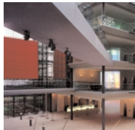
Veranstaltungsort HypoVereinsbank, Haus Ost, München: Von den Erfahrungen anderer Branchen profitieren

* Änderungen vorbehalten. Den aktuellen Stand erfahren Sie unter www.BuchMarktFORUM.de