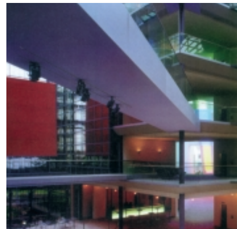
Veranstaltungsort HypoVereinsbank, Haus Ost, München: von den Erfahrungen anderer Branchen profitieren.